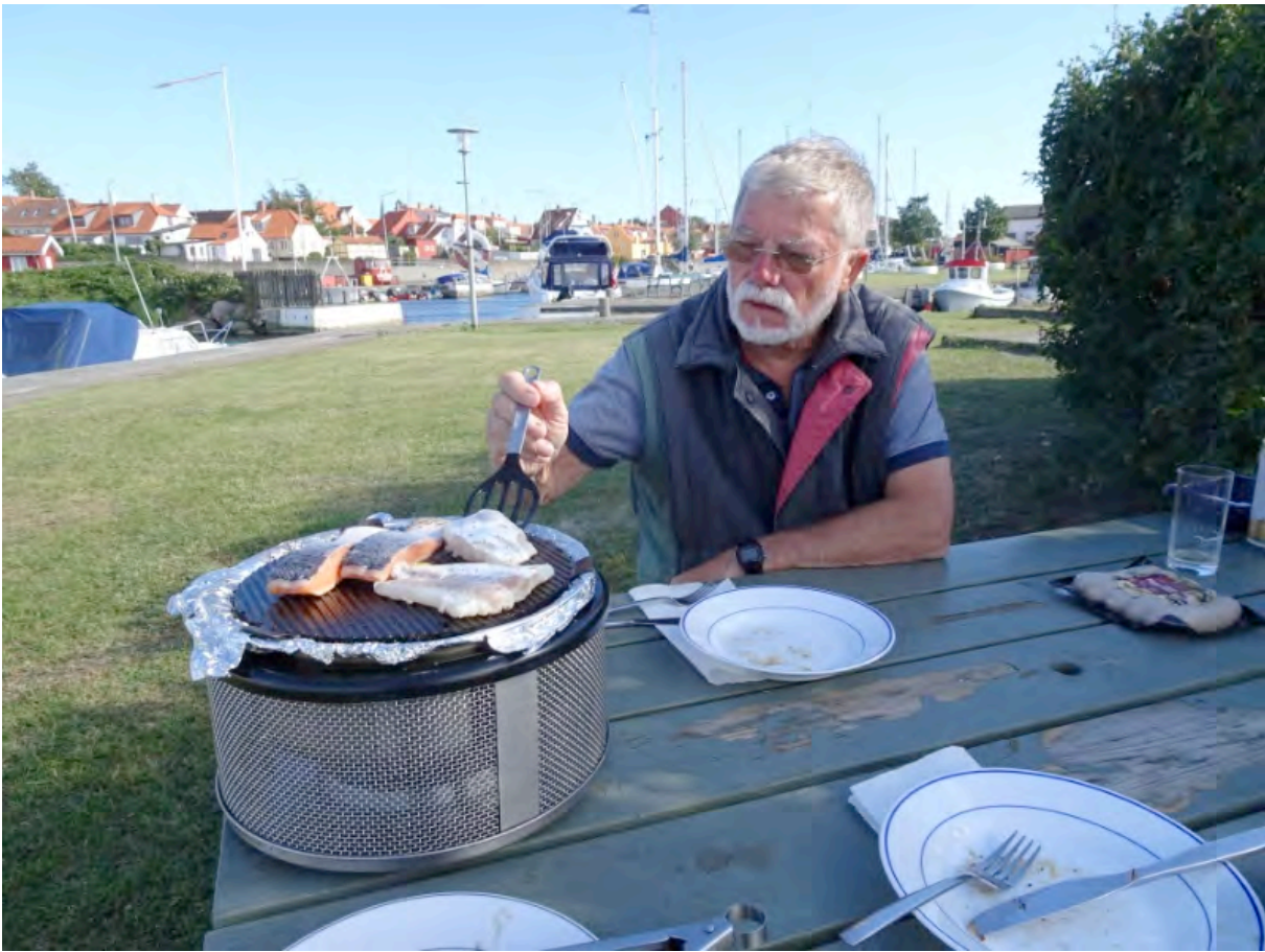
Fisch vom Grill