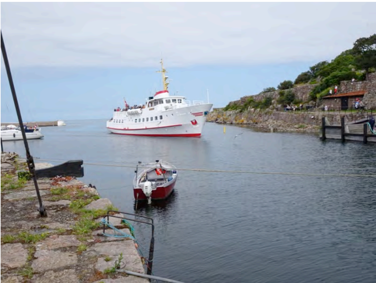
Die Verbindung nach Bornholm