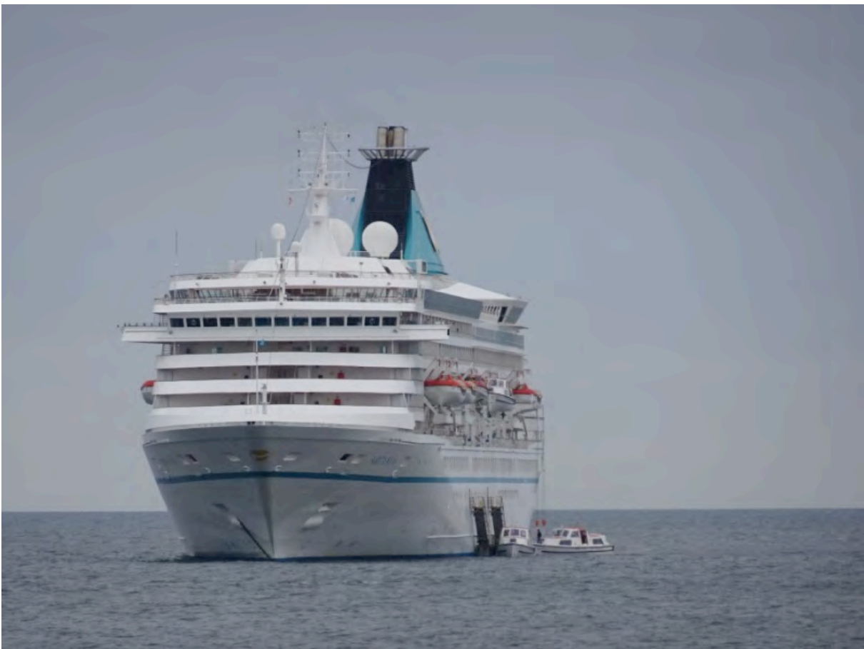
Auch das in dem kleinen Städtchen