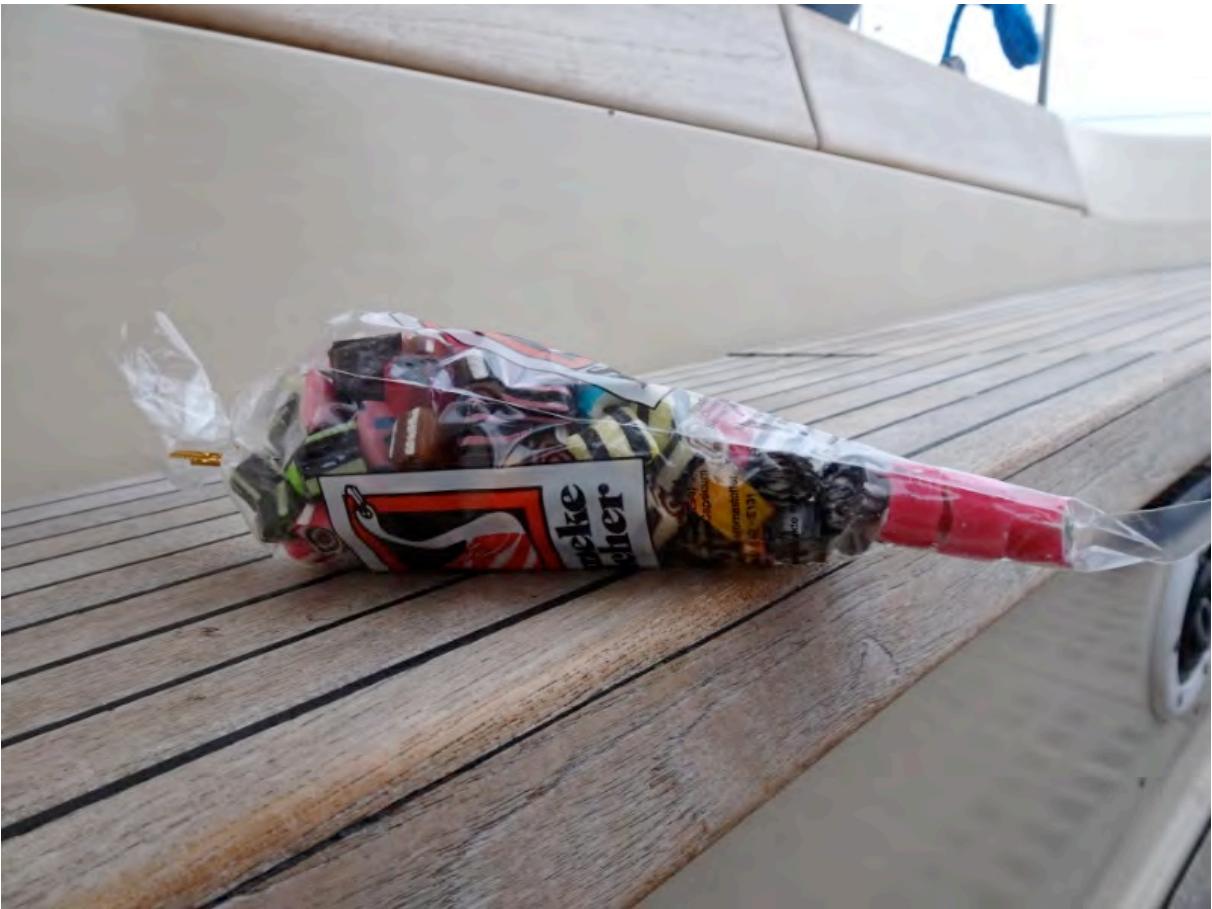
Aus der Bonbonfabrik