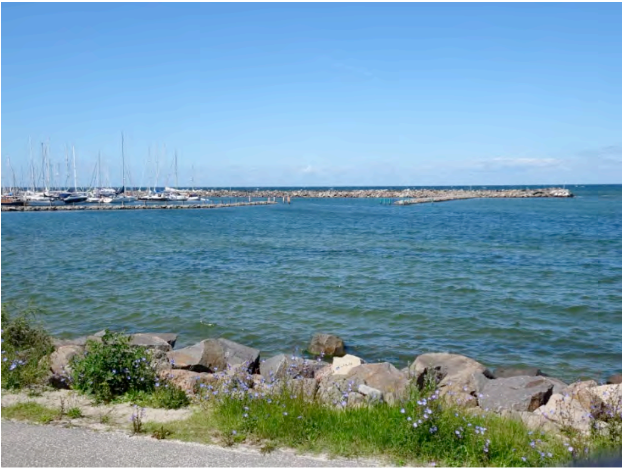
Die Hafeneinfahrt von Rønne