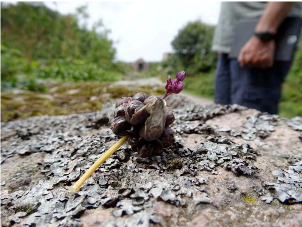
Wilder Knoblauch. Schmeckt gut, ich werde in Berlin eine Anpflanzung versuchen.